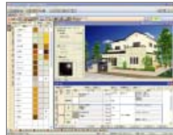
仕様変更シミュレーションも可能