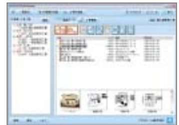
プランデータも一元管理