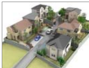
連棟パースも簡単作成