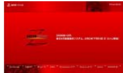
スペシャルサイト TOP