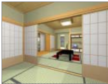
和室表現もリアルに再現