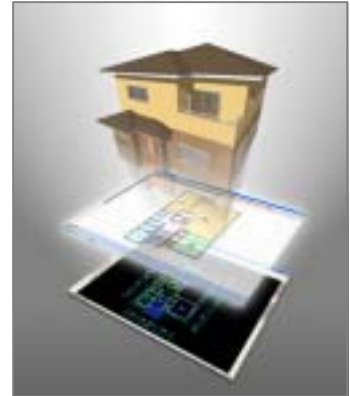
レイヤ情報から自動変換