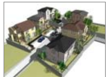
町並み表現も簡単に