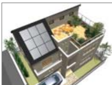
流行のデザイン対応も