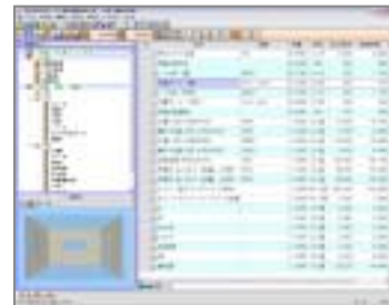
数量根拠も立体で確認可能