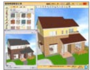
作成中のプラン比較が可能