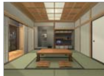
和室表現もリアルに再現