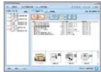
プランデータも一元管理