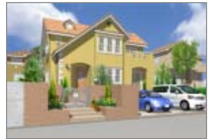
リアルなプラン提案が可能