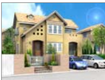
天空光、レンズフレアに対応