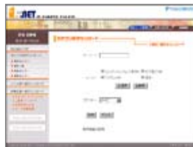
建材データ検索画面

建材メーカー各社から提供される、住宅設備及び建材データを中心に約 16,000 点もの建材データを無料で使用できます。必要な建材データのみをダウンロードする「検索機能」や、登録されている建材メーカーデータを全てダウンロード可能な「メーカー別一括ダウンロード機能」など、多様なダウンロード方法を選択することが可能です。