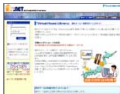
建材メーカー専用画面

登録建材データのダウンロード状況等のレポート報告を実施。地域別、業種別の利用状況も把握可能なため、マーケティングサイトとしての活用も可能です。