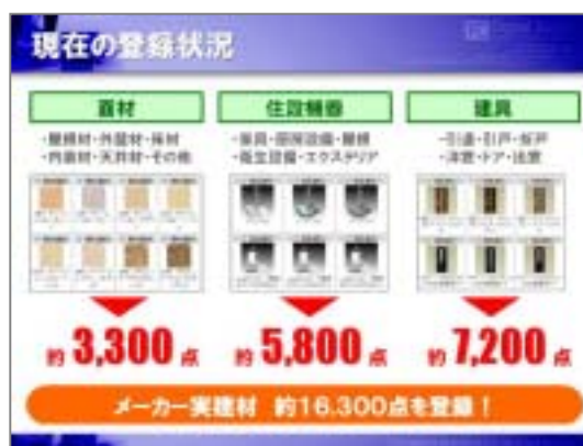
【Virtual House.NET】のデータ登録状況