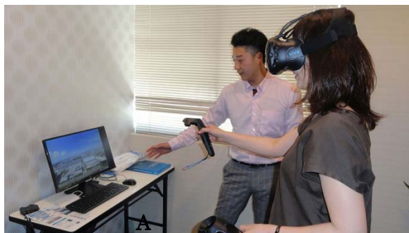
モデルルーム内に VR 専用ルームを常設