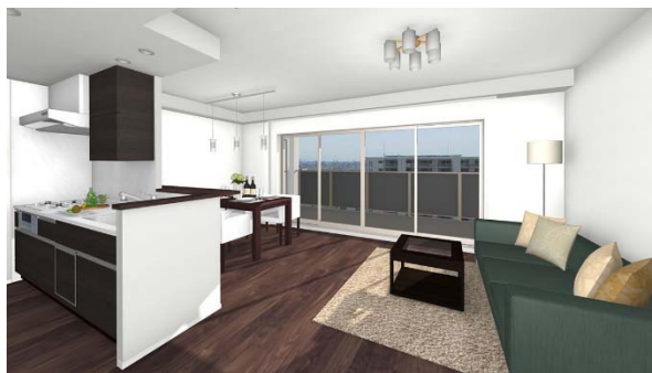
ウォークスルーで住戸空間まで分かりやすく把握