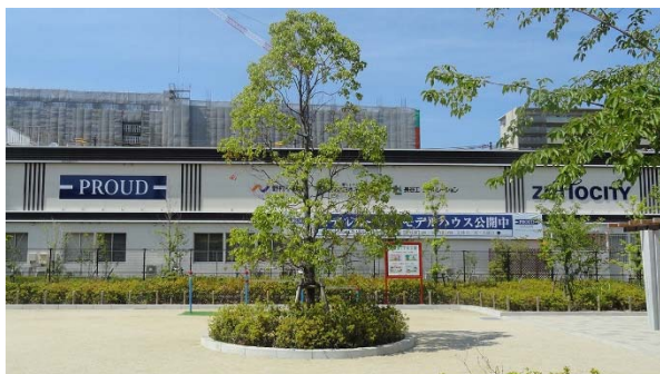
プラウドシティ塚口マンションパビリオン

また、VR 体験以外にも大型モニターに映し出された間取り空間をゲームコントローラで自由に歩き回るウォークスルー体験も可能で、これまでにないマンション提案を実現して、購入検討者のさらなる満足度向上を目指してまいります