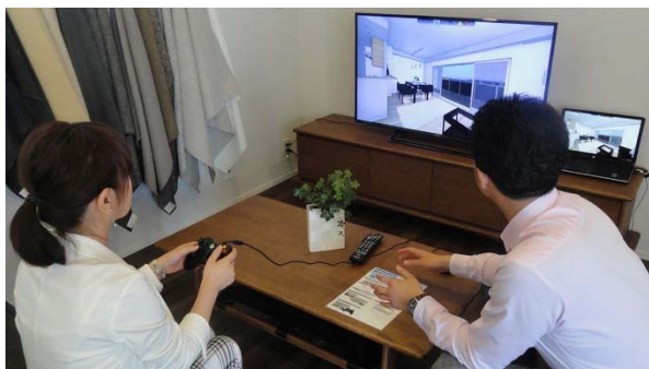
VR だけでなくウォークスルー体験も可能