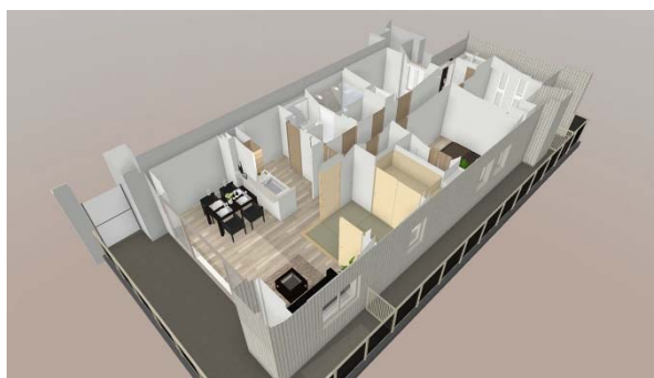
バーチャル模型モードで住戸全体を確認