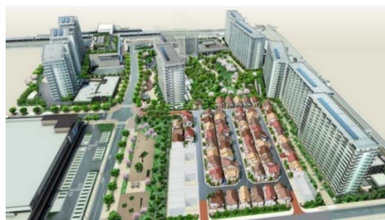
「ZUTTOCITY」全体完成イメージ

最寄りの JR 宝塚線「塚口」駅から JR「大阪」駅まで約 10 分でアクセスできる総開発面積約 8.4ha の関西最大級となる駅前複合再開発プロジェクトです。再開発地内の住宅計画は戸建街区とあわせて総計画戸数 1,271 戸と、JR 駅前再開発事業において 1995 年以降に供給された関西エリアの住宅開発で最大規模となります。