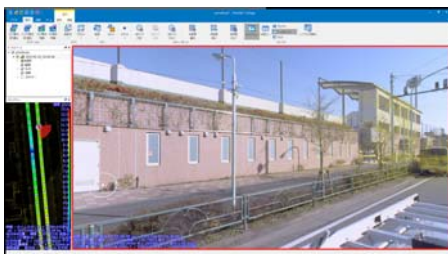
図-1 MAGNET Collage(トプコン) タ)