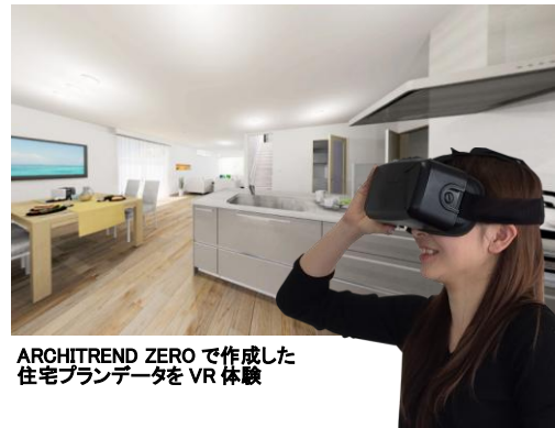
ARCHITREND ZERO で作成した住宅プランデータを VR 体験

設備の使い勝手や室内空間の広さなどは、これまでショールームやモデルハウスでなければなかなか体験できないものでした。「ARCHITREND ZERO」で作成されたプランデータを利用し、オキュラスリフトなどのヘッドマウントディスプレイを装着することで、まるでその場に立っているかのように生活空間を体験することが可能になります。キッチン周りの高さやスペース、リビングなど視線の違いによる空間の広がりなどもリアルに感じることができ、「3D カタログ.com」と合わせて活用することで、1棟1棟プランや仕様が異なる住宅のプレゼンテーションにおいてもリアリティのある提案が可能になります。