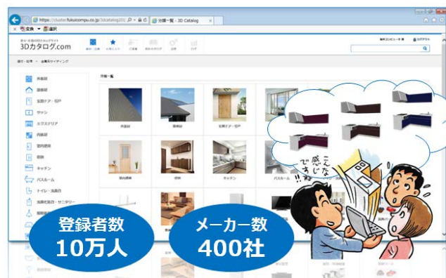
3 D カタログサイトのイメージ

しかしながら、新築・リフォームを行う際、住宅設備や建材の検討は、カタログやサンプルを使用しての検討となる事が多いのが実情です。また、新築やリフォーム予定の空間を使用して検討する事も困難なため、施主は完成イメージを想像しながら商品選定を行うケースが多く見受けられます。