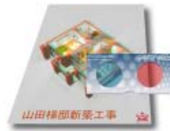
専用眼鏡で覗くと壁や家具が立体的に