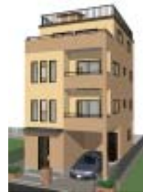
地上 5 階層に対応

狭小住宅などで必要となる、4 階建てや屋上プランの提案が可能。地下 1 階、地上 4 階、屋上 1 階まで階数対応。